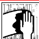
Használjunk ipari papírt vagy tiszta rongyot